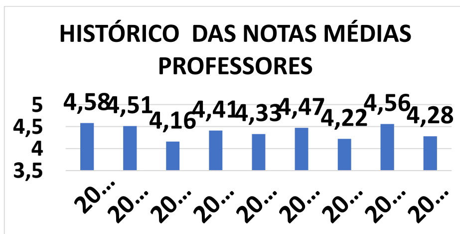
Gráfico 2 – Histórico Médias Professores

Os professores são avaliados semestralmente pelos processos de autoavaliação e existe um feedback aos mesmos por meio das coordenações de curso. O corpo docente é apontado nas avaliações dos alunos, de maneira geral, como qualificado e comprometido com as ações relacionadas ao ensino. Os alunos também consideram que os professores são disponíveis para o atendimento dos mesmos.